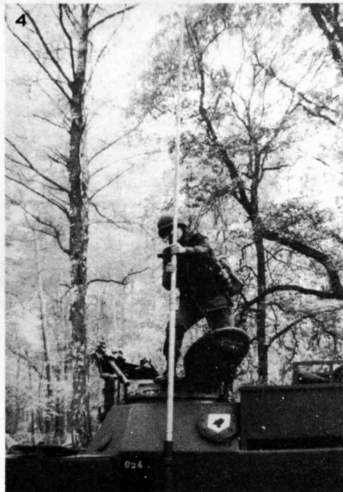
1 DES MOYENS DE TRANSMISSION MODERNES, QUI REQUIERENT DES HOMMES BIEN ENTRAINES.